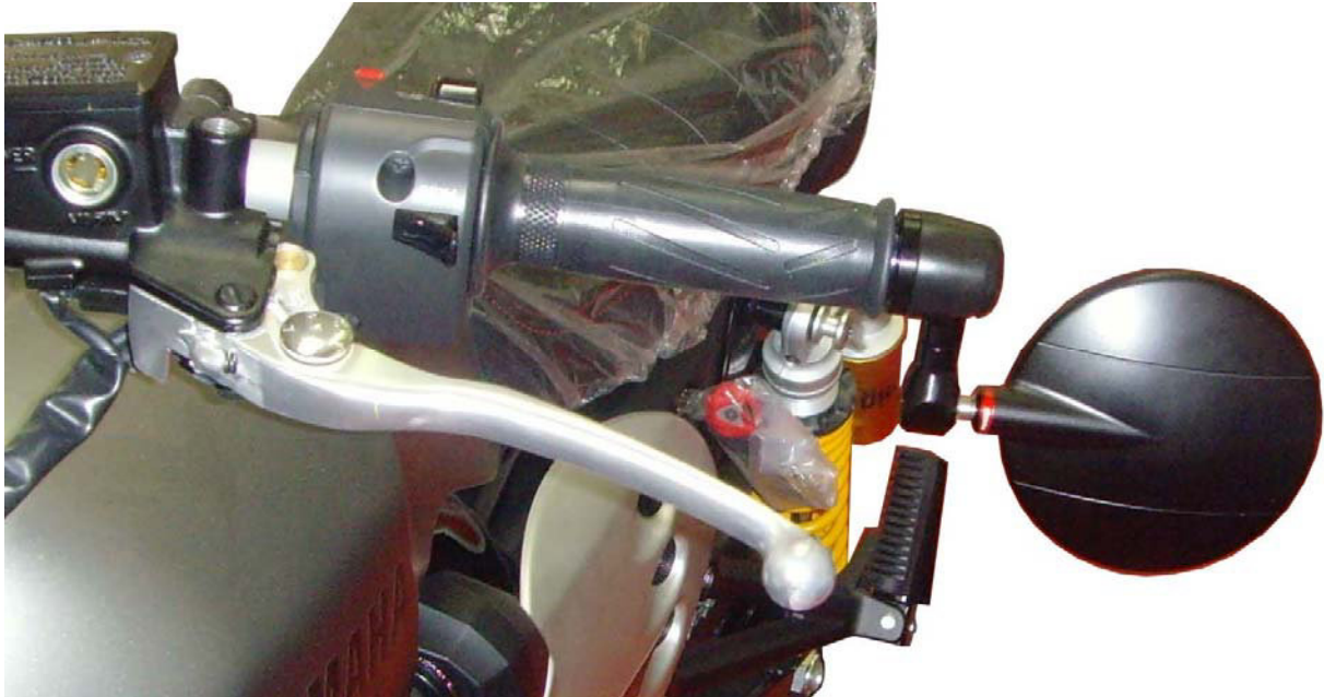
Rizoma Adapterstück in Verbindung mit Rizoma Rückspiegel BS294